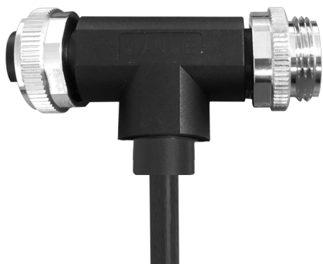
7/8" T型公-母成型式带线缆