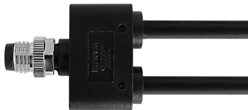
M8 公头成型式双线缆，直头