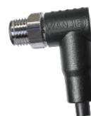
面板式 I型转接器，公-公