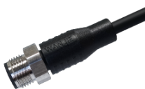
面板式 I型转接器，公-母